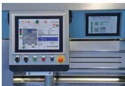
Die hochauflösende Inspektionskamera lässt sich über das intuitive User Interface einfach einrichten. Sie prüft zuverlässig Inhalt und Qualität von Code- und Textelementen. Bei Bedarf werden alle Vorgänge an die Datenbank der Unique Code Software gemeldet.