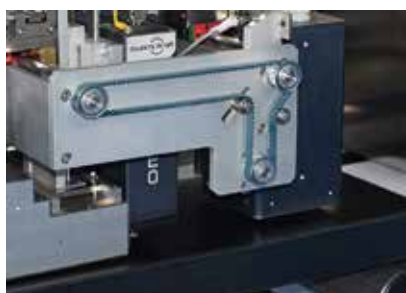
Herzstück der DIGILINE Label – Offline ist der berührungslose OMEGA DoD UV-Inkjetdrucker. Er garantiert auch bei hohen Geschwindigkeiten ein brillantes und beständiges Druckbild. Optional ist eine automatische Reinigungsstation verfügbar, welche die maximale Verfügbarkeit des Drucksystems gewährleistet.